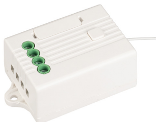
РЕЛЕЙНЫЙ МОДУЛЬ TY-701-WF-SUF (230V, 5A) Арт. 029381