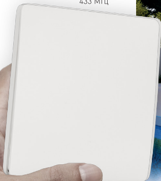
ПАНЕЛЬ TY-228-1-RF-SUF Арт. 029383