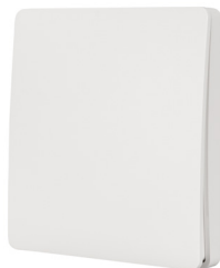
ПАНЕЛЬ TY-228-1-RF-SUF (no power) Арт. 029383