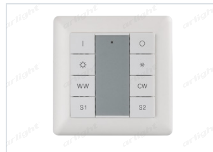
023792 SR-2402K8-DT8-G1-UP (DALI, MIX)