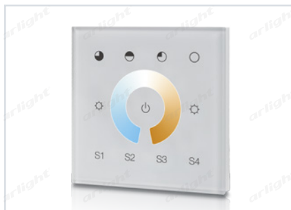
023794 SR-2300TR-DT8-G1-IN White (DALI, MIX)