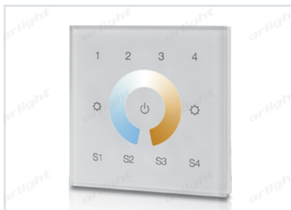
023795 SR-2300TR-DT8-G4-IN White (DALI, MIX)