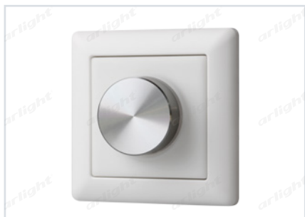
023791 SR-2410RG-DT8 White (DALI, MIX)