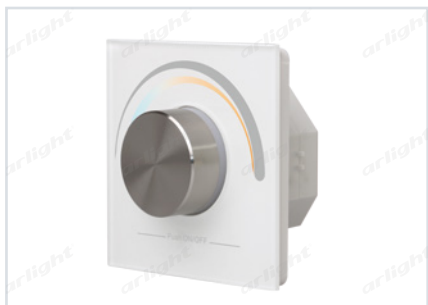
023789 SR-2400RB-DT8-MIX White (DALI, 220V)