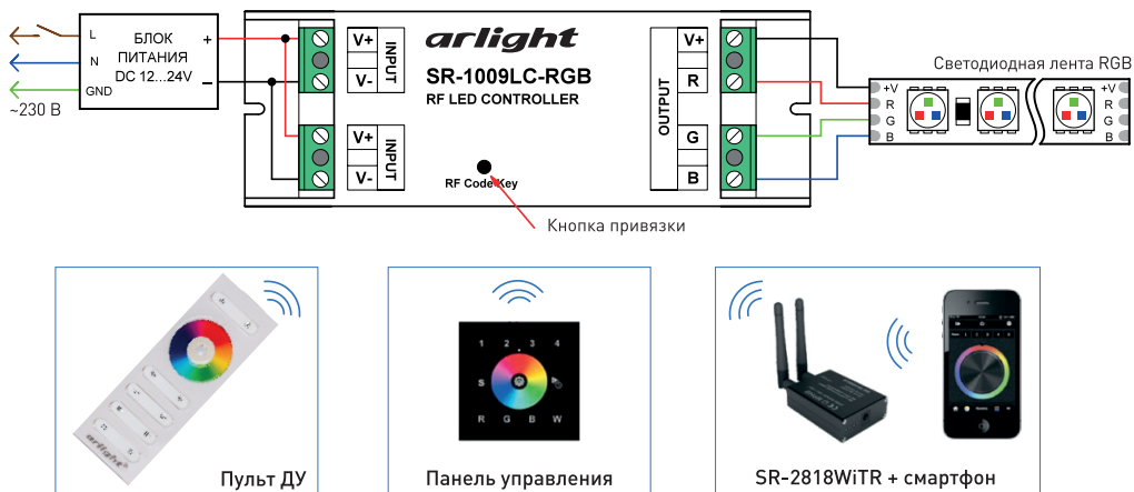
Рис. 2. Схема подключения оборудования на примере контроллера SR-1009LC-RGB.