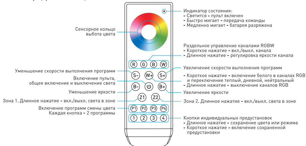
Рис. 1. Функции пульта.

При монтаже оборудования, используемого совместно с пультом, во избежание поражения электрическим током, перед началом работ отключите электропитание. Все работы должны проводиться только квалифицированным специалистом.