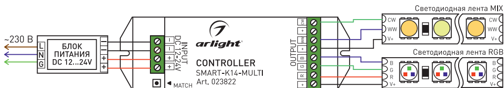
Рисунок 1. Схема подключения контроллера.

3.3. Подключите оборудование, используя возможную схему, приведенную на Рисунке 1. Соблюдайте полярность и порядок подключения проводов к клеммам.