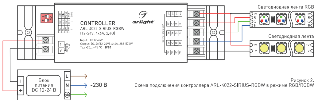
Рисунок 2. Схема подключения контроллера ARL-4022-SIRIUS-RGBW в режиме RGB/RGBW