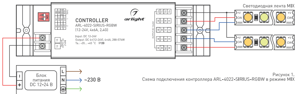
Рисунок 1. Схема подключения контроллера ARL-4022-SIRIUS-RGBW в режиме MIX