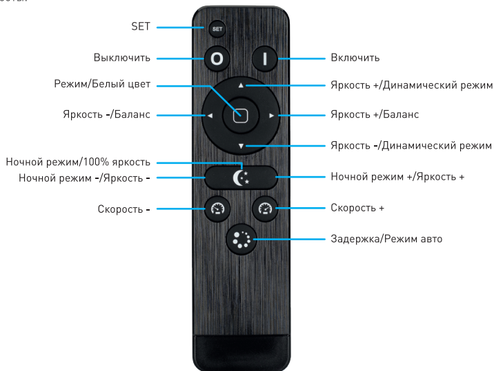
Рисунок 1. Назначение кнопок пульта управления ARL-STICK-DIM

Для режима управления одним цветом (DIM):