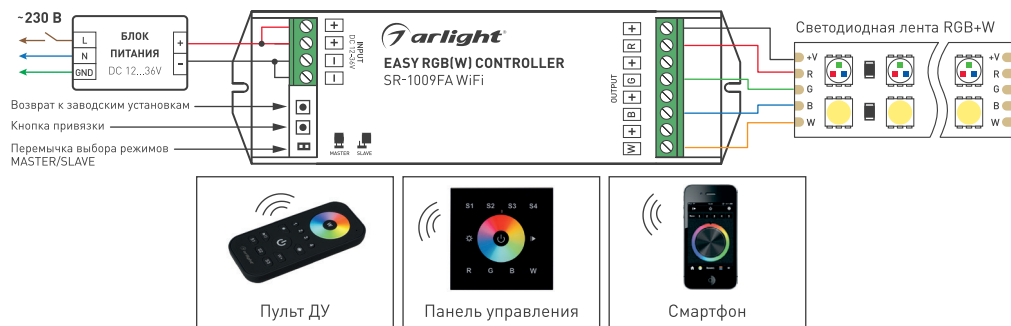
Рисунок 1. Схема подключения и варианты управления контроллером.