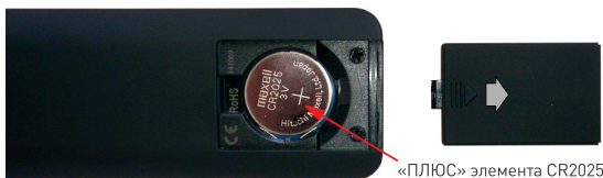
Рис. 1. Установка элемента питания.