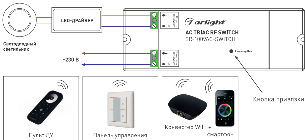
Рисунок 1. Схема подключения.