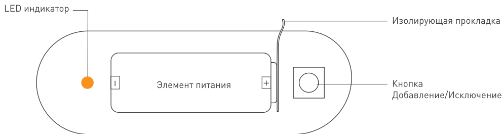
Рисунок 2. Органы управления.