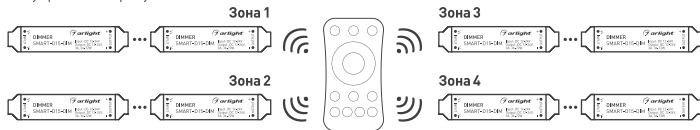
Рисунок 3. Вариант построения системы с 4-зонным пультом дистанционного управления.