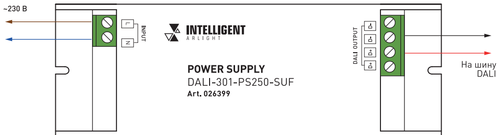
Рисунок 2. Подключение блока питания DALI-301-PS250-SUF.