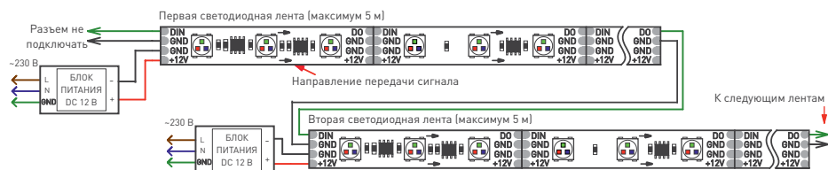
Рис. 1. Схема подключения ленты без использования внешнего контроллера (максимум 1024 пикселя, общий рисунок динамического эффекта при переходе с ленты на ленту сохраняется)