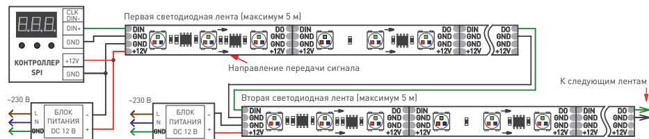
Рис. 2. Схема подключения ленты при управлении от внешнего контроллера