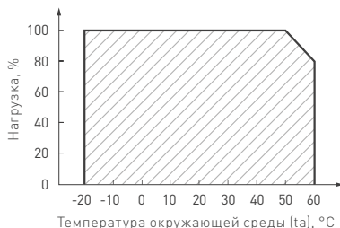
Рис. 2. Максимальная допустимая нагрузка, % от мощности источника.