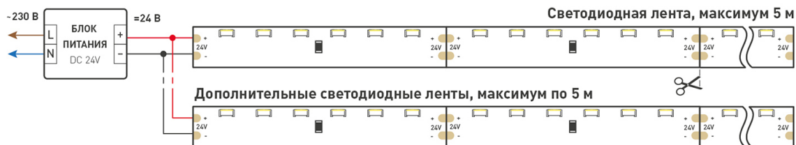
Схема 1. Подключение нескольких светодиодных лент с одной стороны.

Максимальная длина подключения ленты – 5 м (1 катушка).