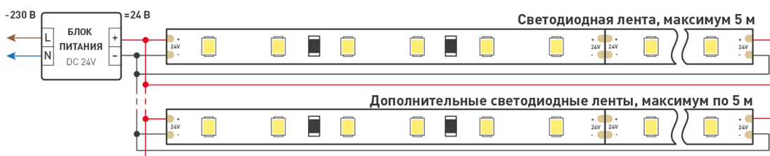
Схема 2. Подключение нескольких светодиодных лент с двух сторон.

Рекомендуется использовать для обеспечения равномерного свечения ленты по всей длине.