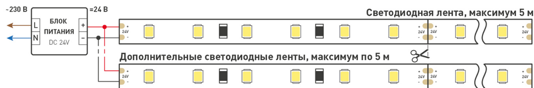
Схема 1. Подключение нескольких светодиодных лент с одной стороны.

Максимальная длина подключения ленты – 5 м (1 катушка).