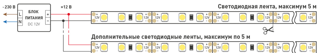
Схема 1. Подключение нескольких светодиодных лент с одной стороны.

Максимальная длина подключения ленты – 5 м (1 катушка).