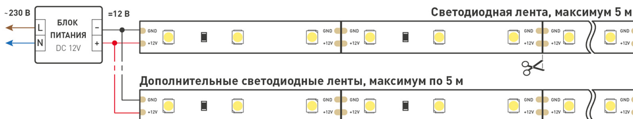
Схема 1. Подключение нескольких светодиодных лент с одной стороны.

Максимальная длина подключения ленты – 5 м (1 катушка).